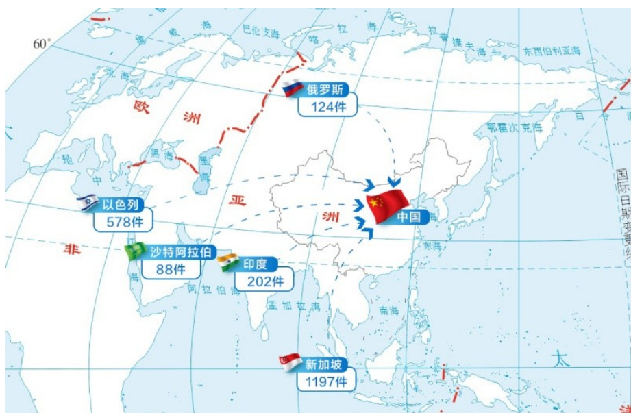
图 2 2018 年上半年主要沿线国家在华专利申请状况

2018年上半年，沿线国家在华专利申请 2,681 件 3 ，同比增长 31.6%。涉及 37 个沿线国家，比 2017 年同期增加 4 个国家。其中，新加坡在华专利申请 1,197 件，同比增长 54.5%，申请量仍居沿线国家之首；以色列在华专利申请 578 件，居第二位；印度、俄罗斯和沙特阿拉伯位居第三至第五位，在华专利申请量分别为 202 件、124 件和 88 件。前五位沿线国家在华专利申请量共计 2,189 件，占沿线国家在华专利申请总量的 81.6%，仍呈现高度集中的态势（见图 2）。