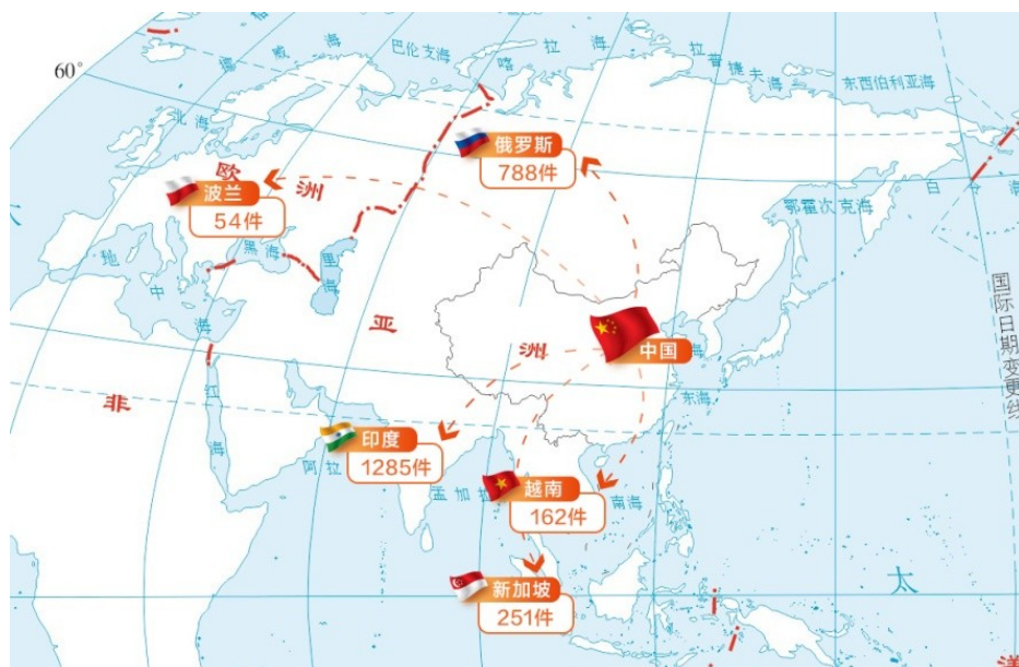
图 1 2018 年上半年中国在主要沿线国家专利申请公开状况

年同期增长 26.9%。其中，中国在印度专利申请公开量为 1,285 件，申请公开量持续居所有目的国之首，同比增长 25.0%；在俄罗斯专利申请公开量为 788 件，居第二位；新加坡、越南和波兰位居第三至第五位，专利申请公开量分别为 251 件、162 件和 54 件。中国在前五目的国专利申请公开量共计 2,540 件，占比 92.1%，专利申请布局持续呈现高度集中的态势（见图 1）。