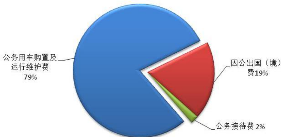
图 4: “三公”经费支出结构