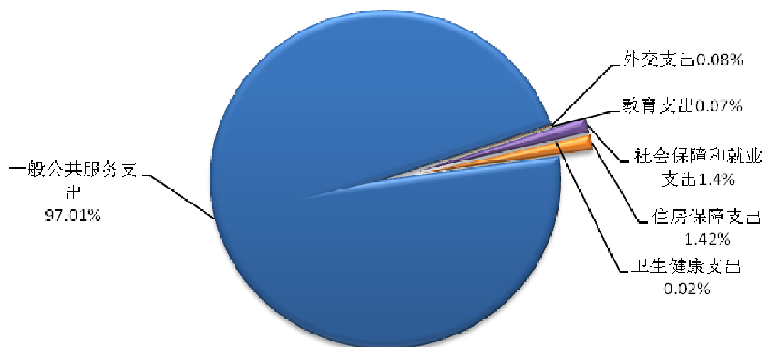
图 3：财政拨款支出结构

购房补贴（项）支出 4,287.82 万元，主要用于向无房职工、住房面积未达到规定标准的职工等发放的住房补贴及一次性补贴，完成年初预算的 100.9%。